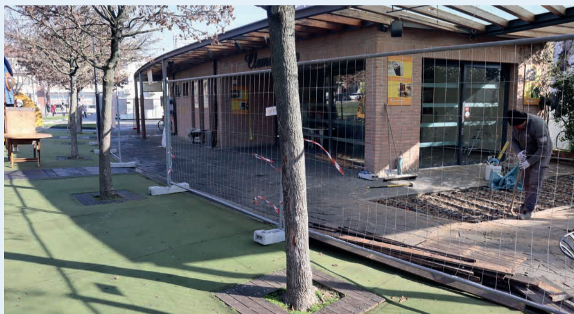
Il cantiere dei lavori in corso alla struttura adibita a bar presso il Parco del Campo della Fiera

Il progetto prevede l'ampliamento della zona di somministrazione del bar attraverso la chiusura dell'area attualmente coperta dal pergolato a ridosso del fabbricato in muratura con installa-