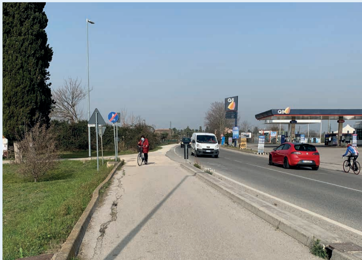
Via Trasversale Marecchia all'altezza del cimitero di San Martino dei Mulini

“Nei prossimi mesi valuteremo le diverse opzioni progettuali – aggiunge la vice sindaca – tenendo conto che il nuovo percorso in sicurezza partirà