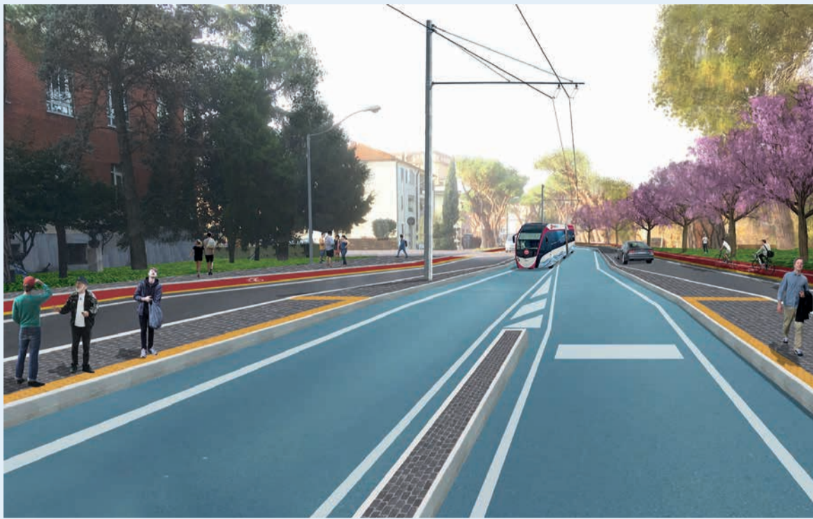
Un rendering del Trasporto rapido realizzato dal Comune di Rimini

La sindaca Parma: "Occasione storica per realizzare un sistema integrato di mobilità sostenibile"