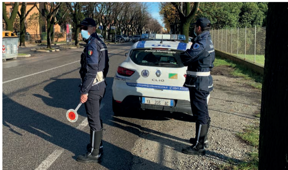
Agenti della Polizia locale di vallata durante un pattugliamento in viale Gaetano Marini

Per l'assessore alle Politiche per la sicurezza del Comune di Santarcangelo, Filippo Sacchetti, la risposta in termini di azioni preventive, presidio del territorio e attività per promuovere la sicurezza e la coesione sociale da parte della Polizia locale è stata all'altezza dell'emergenza causata dalla diffusione del Coronavirus. "Non dobbiamo dimenticare – conclude l'assessore Sacchetti – che soprattutto nei primi mesi del lockdown la Polizia locale è stata un punto di riferimento per tantissimi cittadini in difficoltà in seguito all'introduzione di limitazioni mai vissute prima".