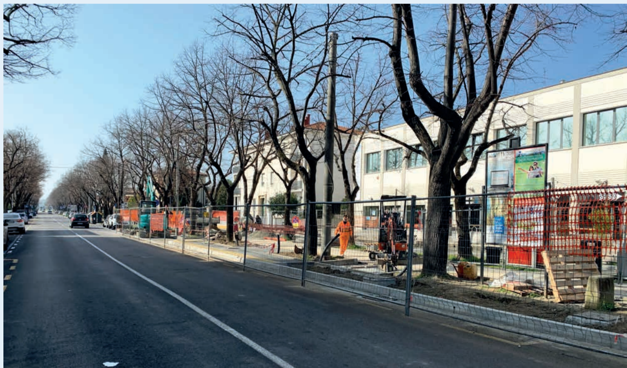
I lavori in corso alle fermate del trasporto pubblico locale in viale Marini

Nel dettaglio, il progetto prevede la realizzazione di idonee piattaforme nelle fermate degli autobus, dotate sia di rampe che di pavimentazione tattile per il superamento delle barriere architettoniche e di un collegamento pedonale tra le vie Garibaldi e Marini, all'altezza di via Sancis. In quest'ultima via, per aumentare la sicurezza dell'incrocio, entrerà in vigore il divieto di svolta a sinistra da via Sancis su viale Marini. A completare la riqualificazione generale dell'intera area, verranno realizzate aiuole verdi.