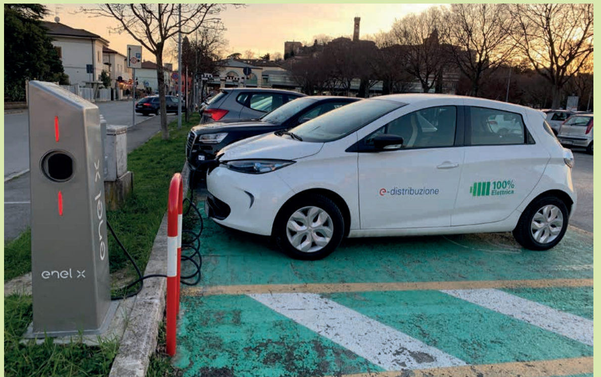
La colonnina di ricarica elettrica presente nel parcheggio Francolini

del pulito, infine, Santarcangelo ha risparmiato 524.465 bottiglie di plastica e quasi 95.000 chilogrammi di CO 2 . L'utilizzo degli erogatori ha però subito uno stop forzato che ha ridotto i consumi del 30 per cento rispetto al 2019 a causa della chiusura imposta, da marzo a maggio 2020, dalle disposizioni anti-Covid. Cinque invece gli erogatori installati nelle due sedi della scuola Franchini per favorire la riduzione di uso delle bottiglie di plastica da parte degli studenti.