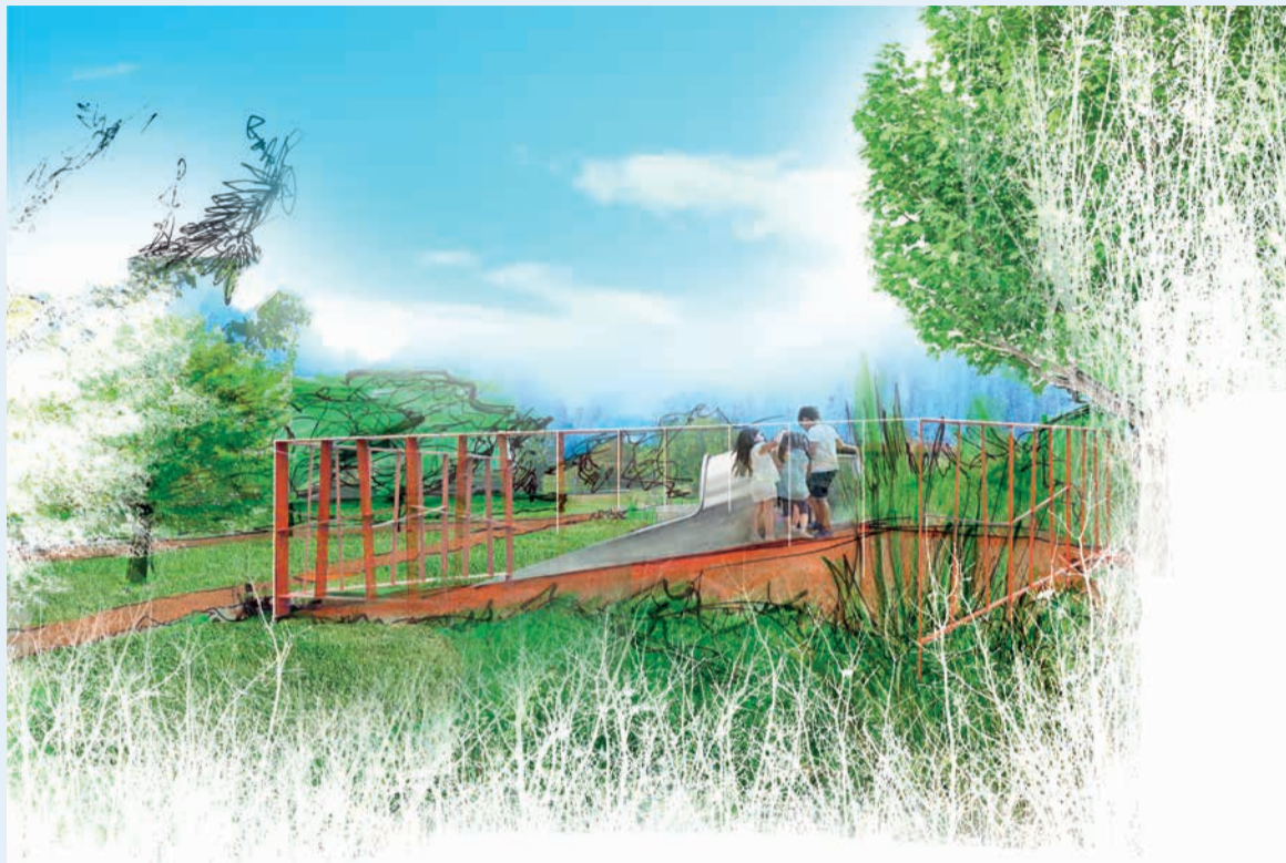
Un rendering del progetto di realizzazione del parco archeologico Macabucco

Al centro del parco l'accumulo di detriti esistente verrà trasformato in una collina panoramica. Utilizzando il "lining out" (una tecnica di marcatura del terreno attraverso specifici elementi) verranno evidenziati i punti in cui si trovano le fornaci sepolte sotto il terreno, così da poterle raccontare ai fruitori del parco. In corrispondenza dei resti delle fornaci, verranno collocati a terra dei dischi di