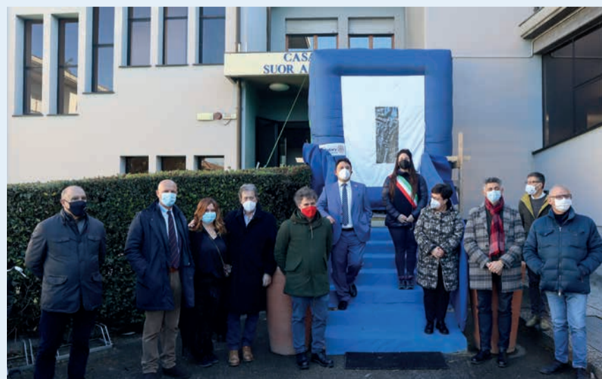
L'apertura ufficiale della stanza degli abbracci presso la residenza per anziani "Suor Angela Molari"

Soddisfatti anche gli operatori sanitari, il presidente dell'Asp Ferri e quello della cooperativa L'Aquilone Dall'Acqua che hanno ripercorso i momenti di difficoltà e sconforto – sia per i pazienti che per il personale – causati dall'emergenza sanitaria e affrontati con successo grazie al lavoro di squadra e alla dedizione degli operatori sanitari e socio-assistenziali.